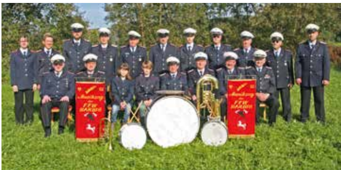
Der Musikzug der Freiwilligen Feuerwehr Barbis gibt am Ostermontag, 28. März, sein traditionelles Konzert im Kurhaus. Beginn ist um 10 Uhr.